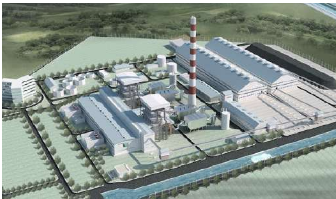
DỰ ÁN NHIỆT ĐIỆN THÁI BÌNH