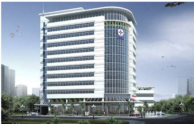
TRỤ SỞ ĐIỆN LỰC TỈNH KHÁNH HÒA