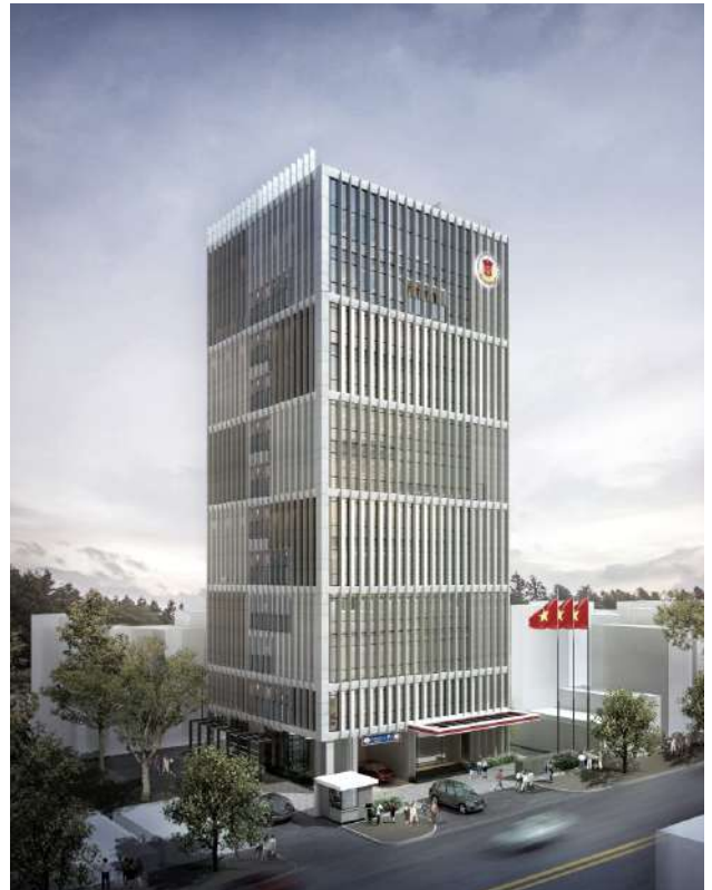
KIỂM TOÁN NHÀ NƯỚC CƠ SỞ II - PHÍA NAM