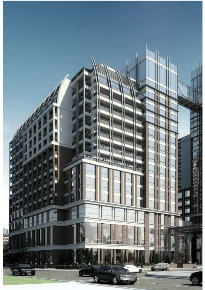
KHÁCH SẠN DẦU KHÍ THÁI BÌNH