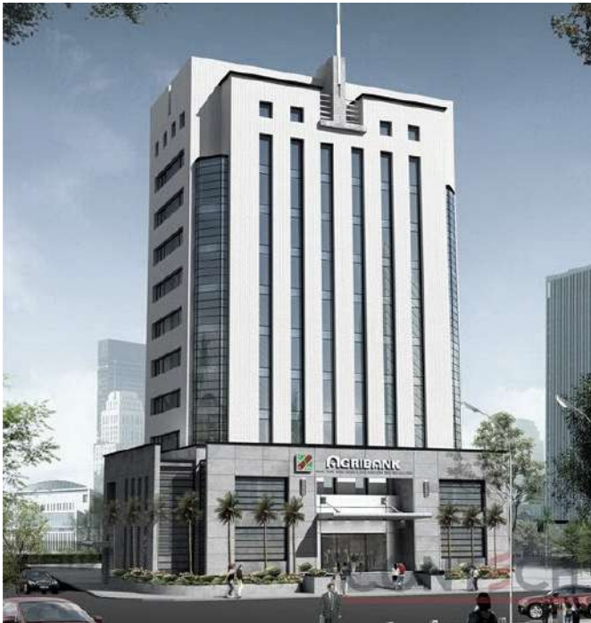
NGÂN HÀNG AGRIBANK NAM ĐỊNH