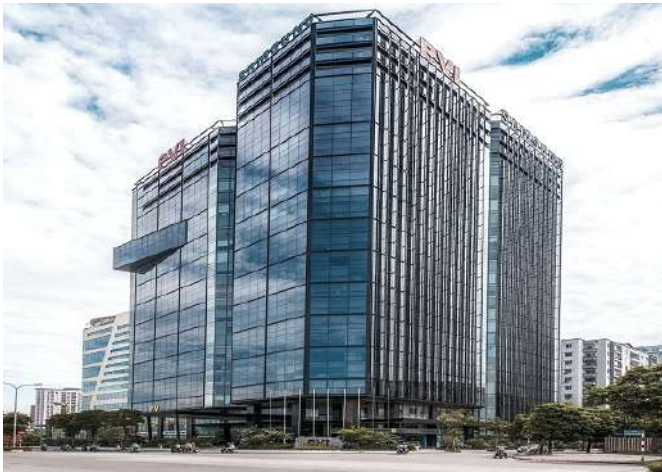
CÔNG TY BẢO HIỂM ĐẦU KHÍ PVI