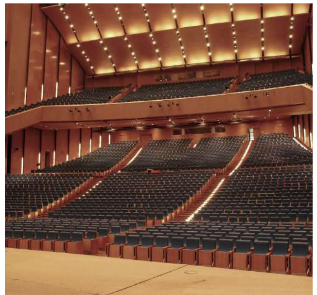
TRUNG TÂM HỘI NGHỊ QUỐC GIA