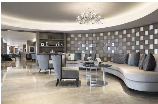
KHÁCH SẠN JW MARRIOTT HÀ NỘI