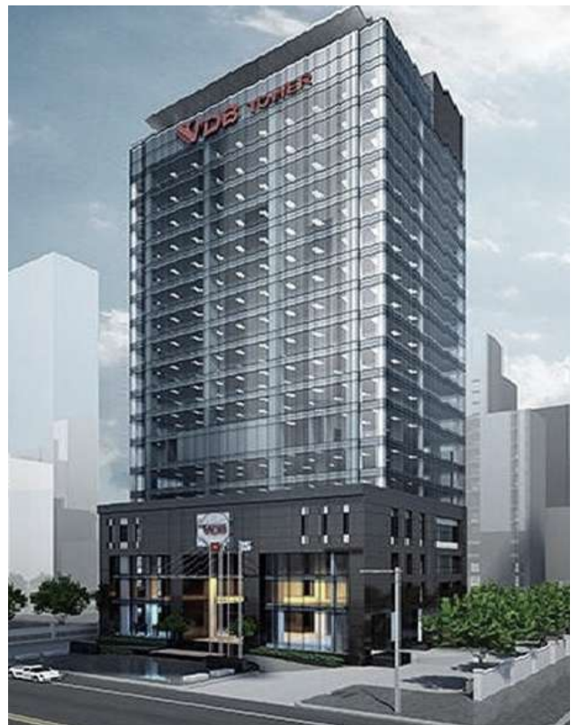
NGÂN HÀNG PHÁT TRIỂN VIỆT NAM