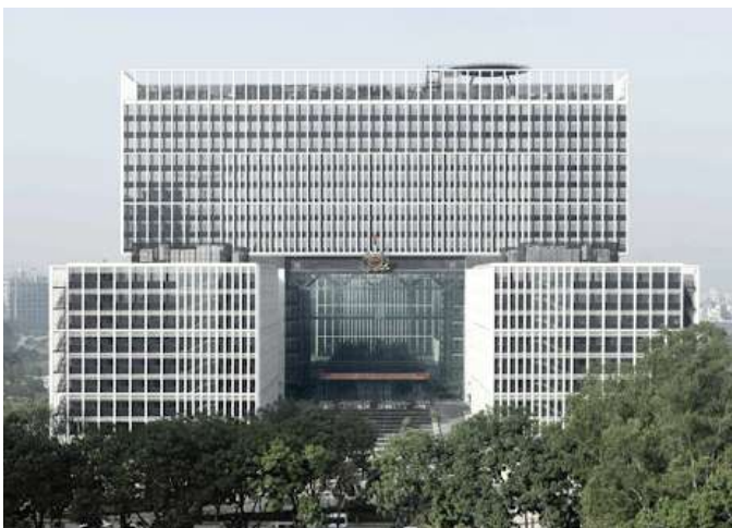
TRỤ SỞ LÀM VIỆC – BỘ CÔNG AN