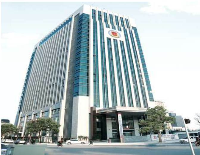
KIỂM TOÁN NHÀ NƯỚC CƠ SỞ II