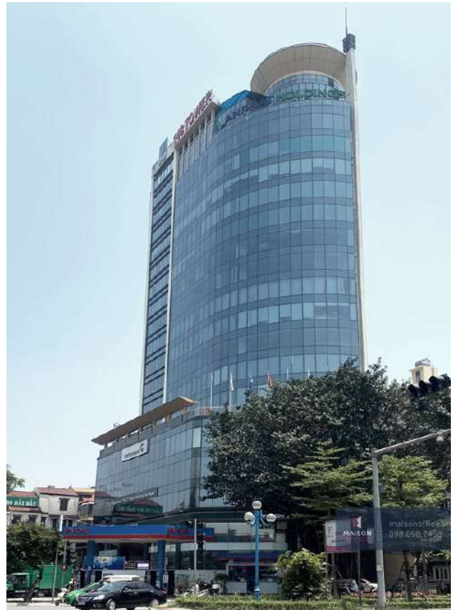
TÒA NHÀ PVI-OIL