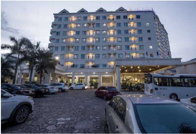
KHÁCH SẠN HERITAGE HẠ LONG