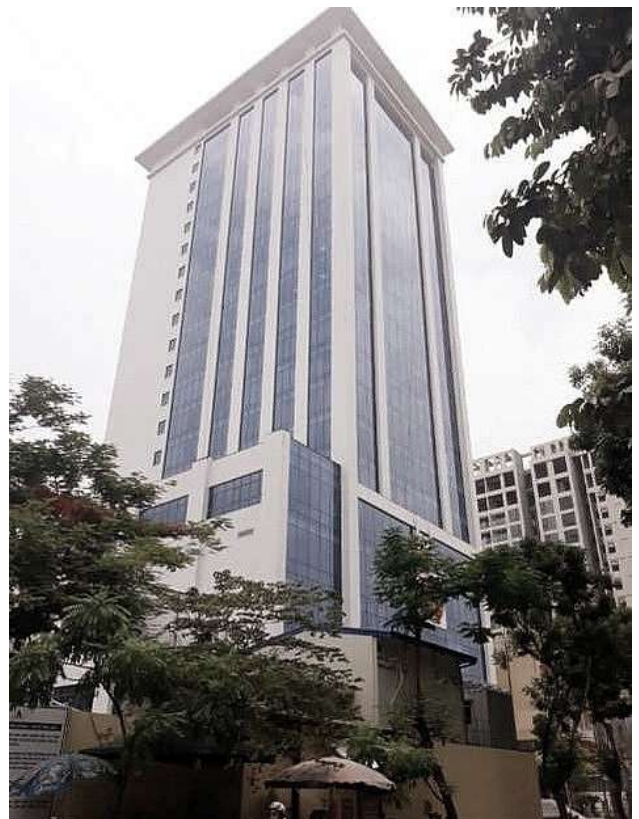
NGÂN HÀNG PHÁT TRIỂN VIỆT NAM