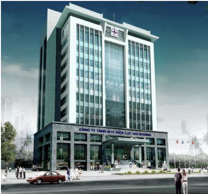
TRỤ SỞ ĐIỆN LỰC TỈNH HẢI DƯƠNG